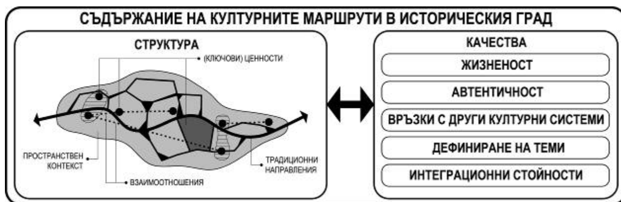
Фиг. 1. Модел на структурата и съдържанието на културния маршрут в историческия град; © Схема: ст. ас. арх. Доника Георгиева

Съдържанието на културните маршрути в историческия град (фиг. 1) се определя от тяхната структура като система и носените от нея качества: жизненост; автентичност; връзки с други културни системи на по-високи и на по-ниски териториални нива; възможност за дефиниране на теми; и интеграционни стойности.