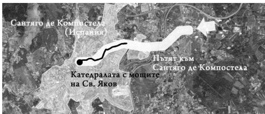
Фиг. 4. Културен маршрут в историческия град – фрагмент-генератор на крайна цел на културен път от по-високо териториално ниво (Сантяго де Компостела); © Схема: ст. ас. арх. Доника Георгиева; карта: Google Maps