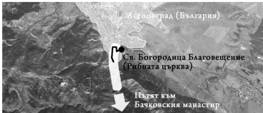
Фиг. 3. Културен маршрут в историческия град – фрагмент-генератор на културен път от по-високо териториално ниво (Асеновград); © Схема: ст. ас. арх. Доника Георгиева; карта: Google Maps

За пример отново можем да си послужим с Асеновград, който е генераторът на пътя на традиционното литийното шествие от църквата "Св. Богородица Благовещение" (Рибната църква) в града до Бачковския манастир.