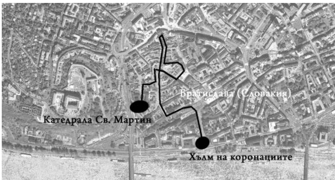
Фиг. 5. Културен маршрут в историческия град - изцяло живеещ в рамките на селището (Братислава);

© Схема: ст. ас. арх. Доника Георгиева; карта: Google Maps