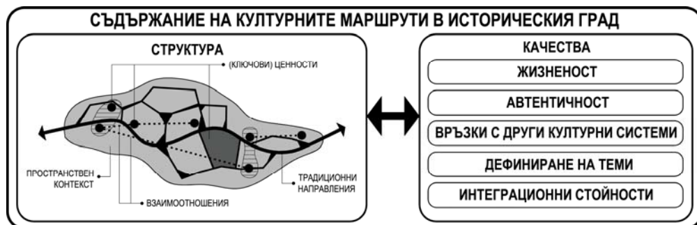
Фиг. 2. Културен маршрут в историческия град – структура и съдържание

На тази основа (и в съответствие със съществуващата теория и практика), се формулира следното определение за същността на понятието културен маршрут в историческия град : вид културно наследство – комплексна и динамична система, която синтезира ценности и взаимоотношения в историческия град, организирани около традиционно направление в града, жизнено и до днес.