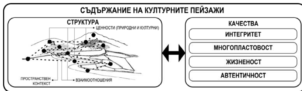
Фиг. 1. Културен пейзаж – структура и съдържание

Културните пейзажи са сравнително нов вид културно наследство, резултат от взаимодействието на природни и антропогенни фактори. Те са свидетелство за устойчивите традиции на използване на природните ресурси и за приемствеността между поколенията. Това ги прави носител на идентичност и изразител на многообразието на култури и природни среди [1]. Така може да се изведе следната дефиниция за културен пейзаж : вид културно наследство – пространствено обособима територия, формирана в резултат от взаимодействието на природни и културни фактори като устойчива културна система, която се базира на автентични ценности от различен характер, обвързани функционално, пространствено и/или смислово.