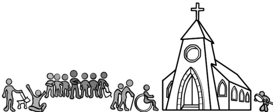
Фиг. 3. Достъпност културното наследство

Често разбирането за достъпност се ограничава до осигуряване на физическа достъпност за лица с увреждания. Когато говорим за достъпност до културното наследство, обаче, това не е достатъчно. С поставянето на твърде силен акцент върху физическите увреждания се рискува да се пренебрегнат други видове човешки нужди, за които също следва да се търси подходящо решение. Днес все повече се утвърждава мнението, че културното наследство изисква и други видове достъпност: мисловна, познавателна, културна, визуална, икономическа и т.н. [5].