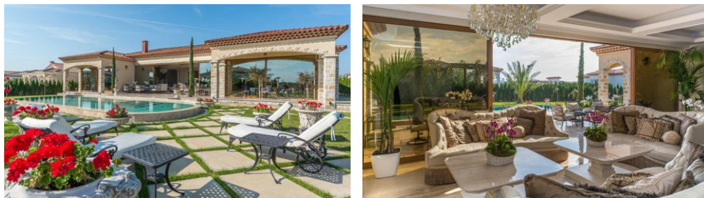
Фиг. 1. Вила „Версай“ в „Eden park“ комплекс, Слънчев бряг, http://privilege-estates.com

Често пъти откриваме в предлаганите оферти, че комплексите от затворен тип се предлагат и рекламират най-вече като нови нива на стандарт на обитаване, характеризиращи се изключително с частния си характер и обещаващи сигурност, хармония и усещане за отделеност и различност от тълпите.