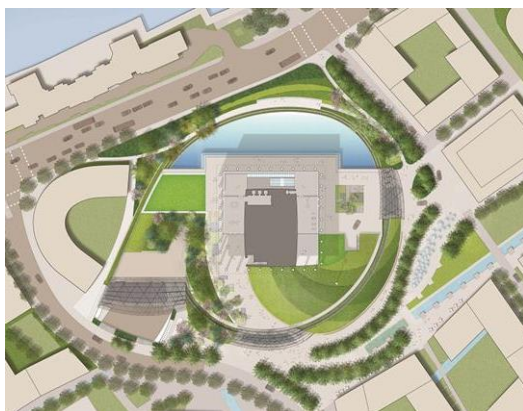
Фиг. 3. Новото посолство на САЩ в Лондон http://www.kieran timberlake.com

Архитектурата на посолствата в последно време е заседнала по предсказуем начин в схватка между желанието да изразят откритост и в „манията“ за сигурност, продиктувана от рисковете в епохата на тероризма.