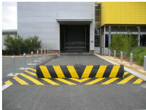
Фиг. 2. Anti-RAM бариери за предотвратяване нарушаването на периметъра на съоръжението от превозни средства