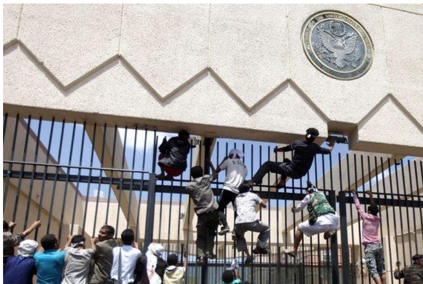
Фиг. 1. Нападение над Американско посолство

От началото на 1990 г., особено след септември 2011 г., положението се влошава. Днес посолствата са крепости. Стените около тях са по-високи, макар и не достатъчно високи, за да ги предпазят от нападение. Както се казва – може да се изгради 5-метрова ограда, но има такова нещо като 6-метрова стълба.