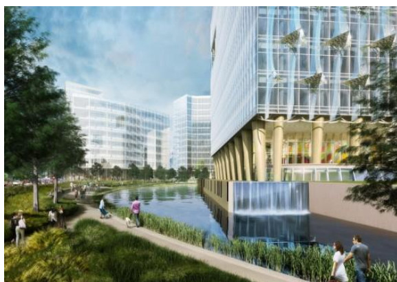
Фиг. 4. Новото посолство на САЩ в Лондон. Изглед и фрагмент от фасадата. http://www.kierantimberlake.com

По отношение на въпросите за сигурността архитектите разработват концепция, която заменя високите огради с елементи от парковата архитектура. В чест на традициите на английската ландшафтна архитектура около сградата на посолството е организиран парк с езерце и тревни тераси, които осигуряват контролирания достъп до сградата. Сигурността е постигната без да се натрапва, няма ги тежките защитни съоръжения, с които сградите приличат на „военни укрепления на фронтната линия“.