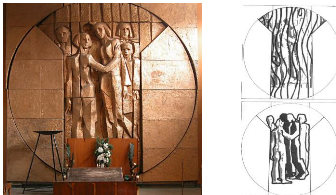
Фиг. 3. „Дом за траурни граждански ритуали в Русе“ – поглед от залата към символно главната художествена стена и концептуалните скици на двата идейни и пластични художествени компоненти: „реката – символ на живота” и „един го няма”