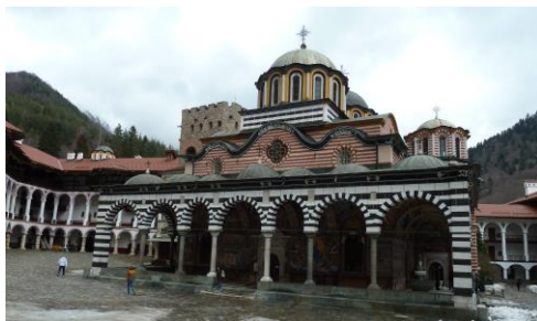
Фиг. 1. Типична Храмова източно православна сграда (Рилски манастир)

Външният образ е доминиран от религията, към която принадлежи, без да се отразява ритуалният смисъл. В интериора чрез различните елементи на каноничното изографисване и необходимите атрибути се отразява съответният на ритуала смисъл и конкретика.