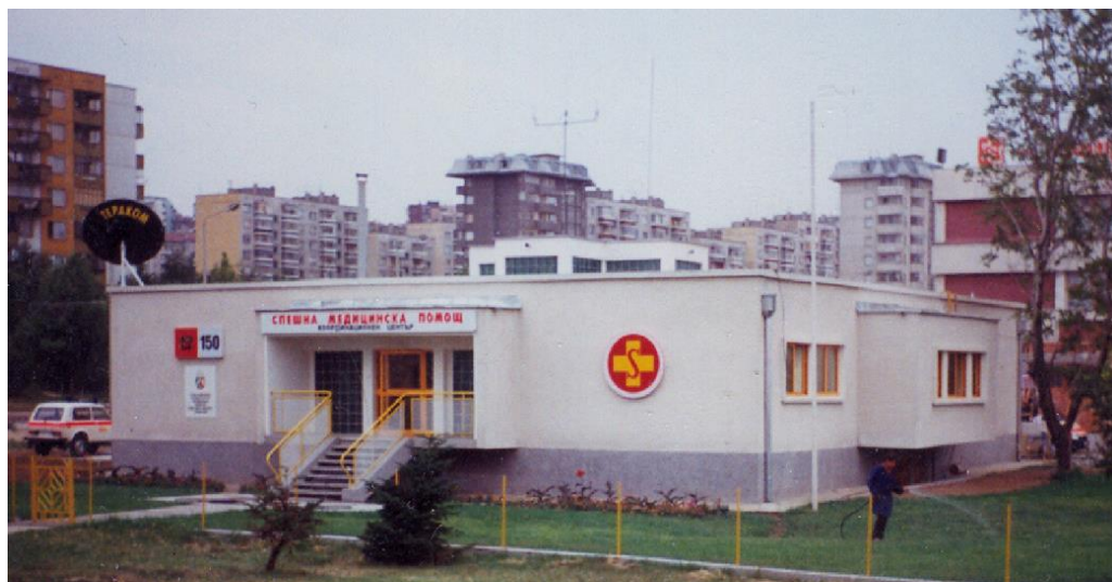
Фиг. 1. Изглед на сградата на Центъра за спешна медицинска помощ в Русе [7]. Източник: Архитектурен проект на арх. В. Бакърджиев

Кръстът, квадратът и кръгът – това са трите основни фигури, а тяхното взаимно преплитане и наслагване осигурява наличието на различни по форма, големина и предназначение помещения, изисквани от инвеститора и необходими за правилното функциониране на Центъра за спешна медицинска помощ. Освен гаражи за 8 реанимобилен, в сградата има диспечерски пункт, санитарни и битови помещения за медицинския персонал, както и зала за събрания и обучение.