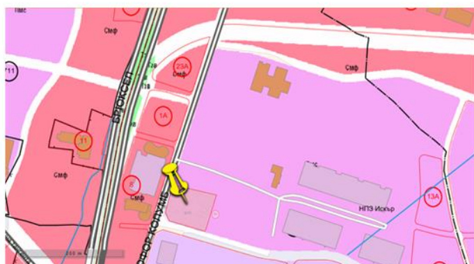
Локализация на имота според ОУП на гр. София